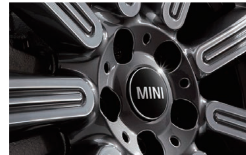
MINI フローティング・センター・キャップ・セット