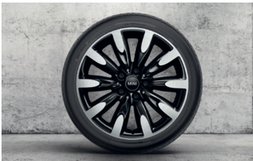
ルーレット・スポーク 502 17" ジェット・ブラック

フロント/リア 7J×17 (ET:54) ¥58,190 (¥52,900) / 1本 3611 6855 111