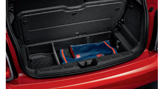
ラゲッジ・ルーム・ボックス