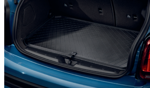
ラバー・ラゲッジ・ルーム・マット エッセンシャル・ブラック

各¥10,670 (¥9,700) 5147 2353 820 3 Door用 5147 2358 313 5 Door用 5147 2411 348 Convertible用