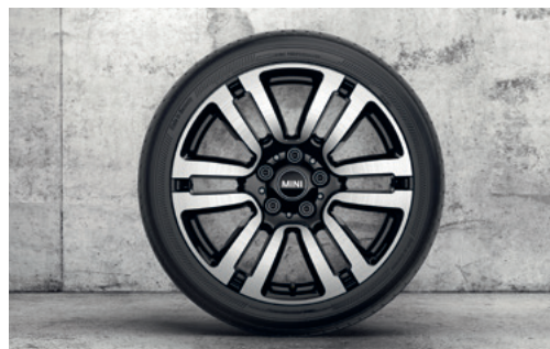
レール・スポーク 497 17" 2トーン ジェット・ブラック

フロント/リア 7J×17 (ET:54) ¥58,190 (¥52,900) / 1本 3610 6873 929