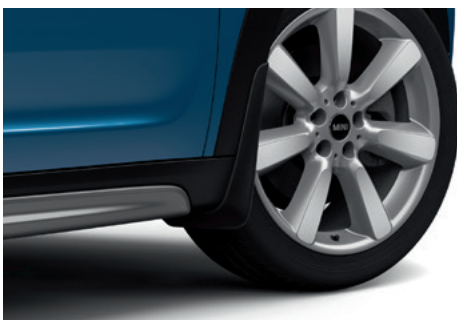
マッド・フラップ