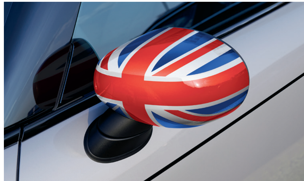
ミラー・キャップ