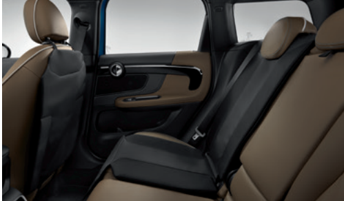
チャイルド・シート・マット