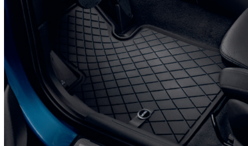
オール・ウェザー・フロア・マット エッセンシャル・ブラック