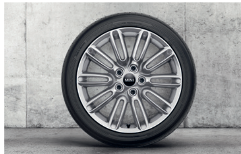
テンタクル・スポーク 500 17" シルバー

フロント/リア 7J×17 (ET:54) ¥50,380 (¥45,800) / 1本 3611 6856 099