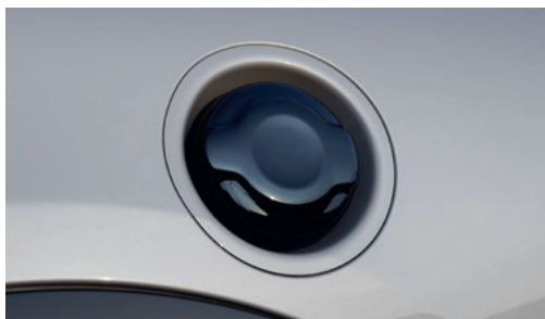
フューエル・キャップ ピアノ・ブラック