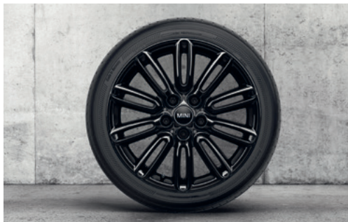
テンタクル・スポーク 500 17" ジェット・ブラック

フロント/リア 7J×17 (ET:54) ¥52,910 (¥48,100) / 1本 3610 6898 290