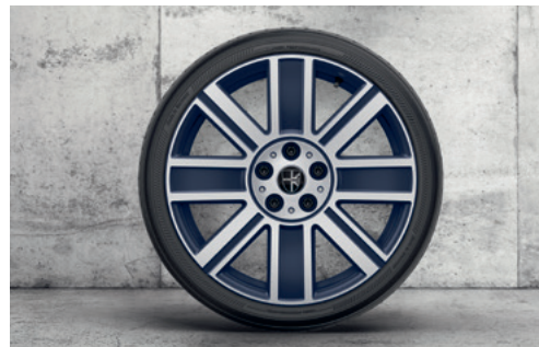
MINI Yuors プリティッシュ・スポーク 820 18" 2トーン エニグマティック・ブラック

フロント/リア 7J×18 (ET:54) ¥62,260 (¥56,600) / 1本 3611 6888 078