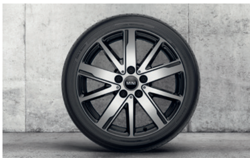
シザー・スポーク 830 17" ジェット・ブラック

フロント/リア 7J×17 (ET:54) ¥62,260 (¥56,600) / 1本 3610 6889 638