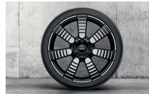
パルス・スポーク 900 18" 2トーン ジェット・ブラック

フロント/リア 7J×18 (ET:54) ¥62,260 (¥56,600) / 1本 3610 6897 988