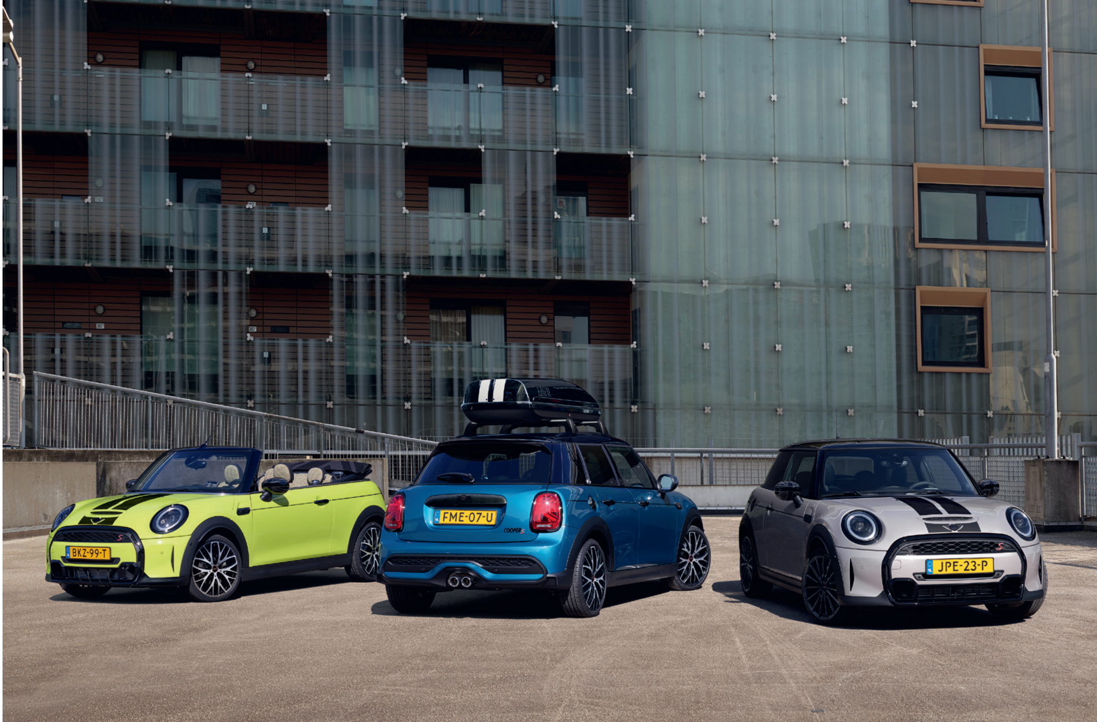
MINI 3 DOOR, MINI 5 DOOR, MINI CONVERTIBLE. MINI ORIGINAL ACCESSORIES.