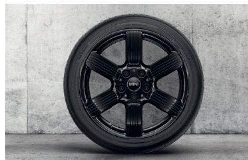
ペダル・スポーク 525 17" ジェット・ブラック

フロント/リア 7J×17 (ET:54) ¥58,190 (¥52,900) / 1本 3610 6898 289