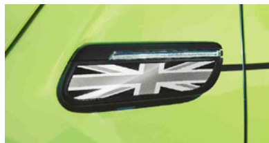
サイド・スカットル