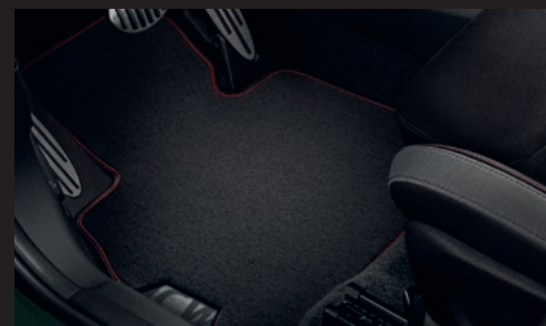
John Cooper Works フロア・マット フロント・セット