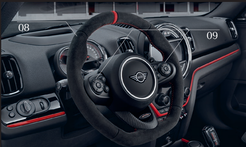
John Cooper Works ステアリング・ホイール [08]