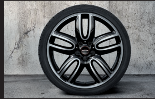
John Cooper Works コース・スポーク 523 19" 2トーン ジェット・ブラック

フロント/リア 8J×19 (ET:47) ¥122,100 (¥111,000) / 1本 3611 6856 038