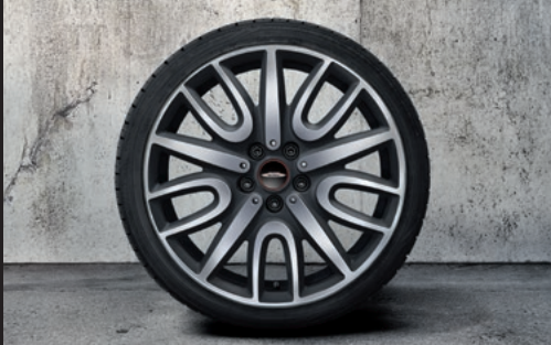
John Cooper Works スリル・スポーク 529 18" ナイト・ブラック

フロント/リア 8J×19 (ET:47) ¥122,100 (¥111,000) / 1本 3610 6888 853