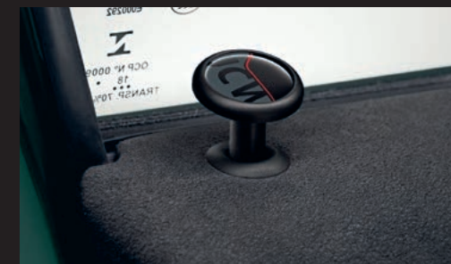
John Cooper Works ドア・ロック・キャップ