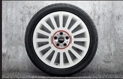
John Cooper Works ラリー・スポーク 536 19" アルビン・ホワイト

フロント/リア 8J×19 (ET:47) ¥122,100 (¥111,000) / 1本 3610 6874 570