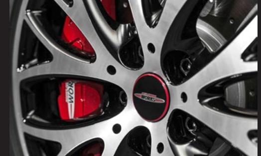
John Cooper Works フローティング・センター・キャップ・セット