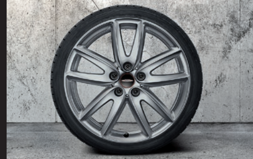
John Cooper Works グリップ・スポーク 815 18" ブライト・シルバー

フロント/リア 7.5J×18 (ET:51) ¥72,270 (¥65,700) / 1本 3610 6888 852