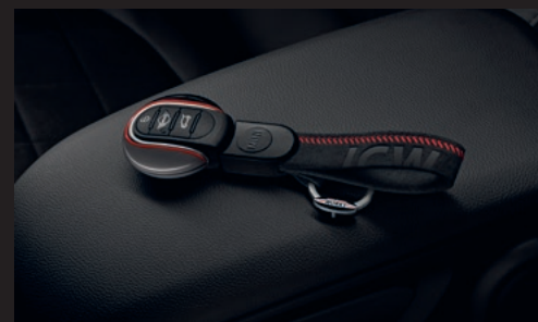
John Cooper Works デザイン・キー・キャップ