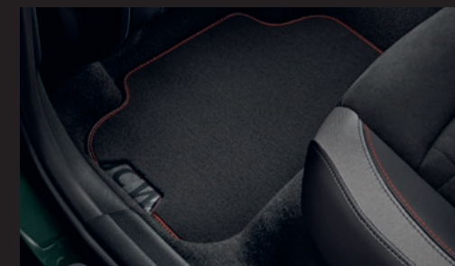
John Cooper Works フロア・マット リア・セット