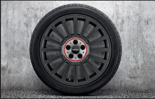
John Cooper Works ラリー・スポーク 536 19" オービット・グレー

フロント/リア 8J×19 (ET:47) ¥122,100 (¥111,000) / 1本 3610 6874 570