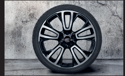
John Cooper Works サーキット・スポーク 592 19" 2トーン ジェット・ブラック

フロント/リア 8J×19 (ET:47) ¥122,100 (¥111,000) / 1本 3611 6856 035