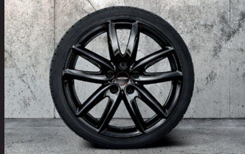
John Cooper Works グリップ・スポーク 815 18" ジェット・ブラック

フロント/リア 7.5J×18 (ET:51) ¥75,900 (¥69,000) / 1本 3610 6888 851