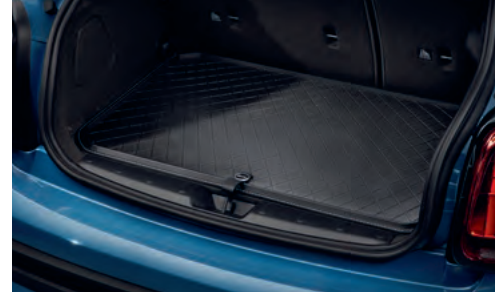
ラバー・ラゲッジ・ルーム・マット エッセンシャル・ブラック

各¥11,660 (¥10,600) 5147 2353 820 3 Door用 5147 2358 313 5 Door用 5147 2411 348 Convertible用