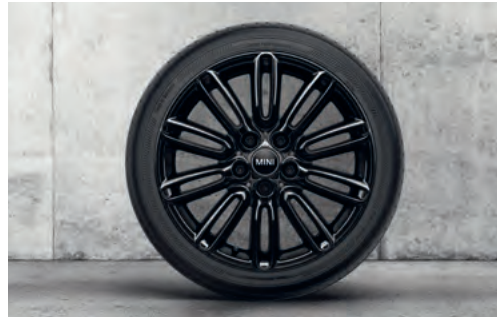
テンタクル・スポーク 500 17" ジェット・ブラック

フロント/リア 7J x 17 (ET:54) ¥56,320 (¥51,200) / 1本 3610 6898 290