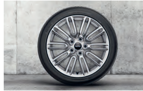
テンタクル・スポーク 500 17" シルバー

フロント/リア 7J x 17 (ET:54) ¥53,680 (¥48,800) / 1本 3611 6856 099