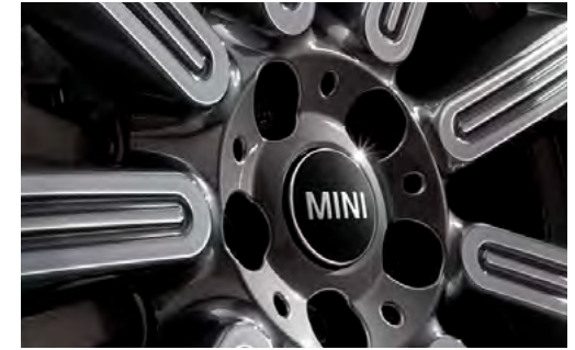
MINI フローティング・ハブ・キャップ