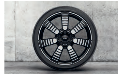
MINI Yuors プリティッシュ・スポーク 820 18" 2トーン エニグマティック・ブラック

フロント/リア 7J×18 (ET:54) ¥66,990 (¥60,900) / 1本 3611 6888 078