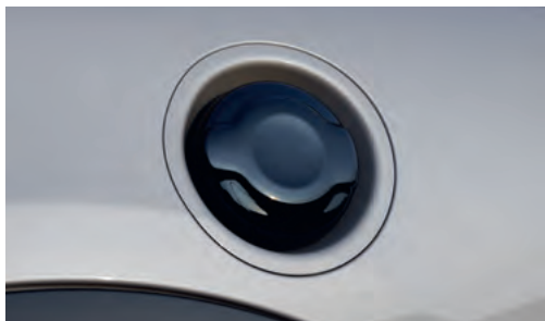
フューエル・キャップ ピアノ・ブラック