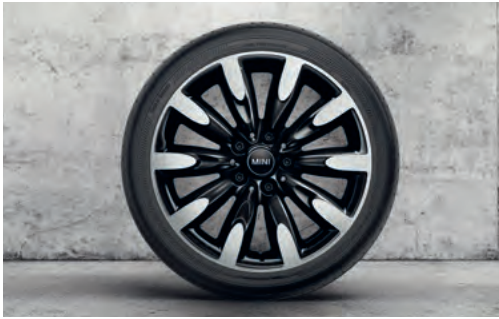
ルーレット・スポーク 502 17" ジェット・ブラック

フロント/リア 7J x 17 (ET:54) ¥62,590 (¥56,900) / 1本 3611 6855 111