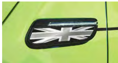
サイド・スカットル