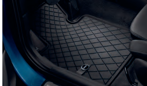
オール・ウェザー・フロア・マット エッセンシャル・ブラック