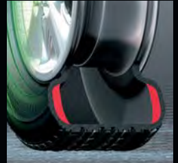
※内圧が失われても、赤い部分がタイヤがつぶれるのを防ぎます。(実際は赤色ではありません)