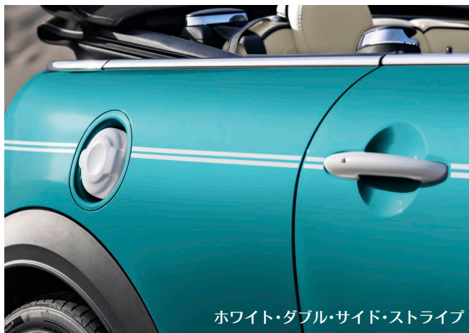
ホワイト・ダブル・サイド・ストライプ