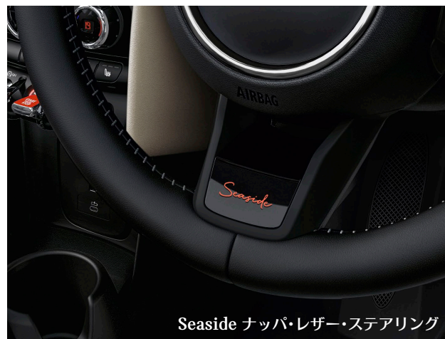
Seaside ナッパ・レザー・ステアリング