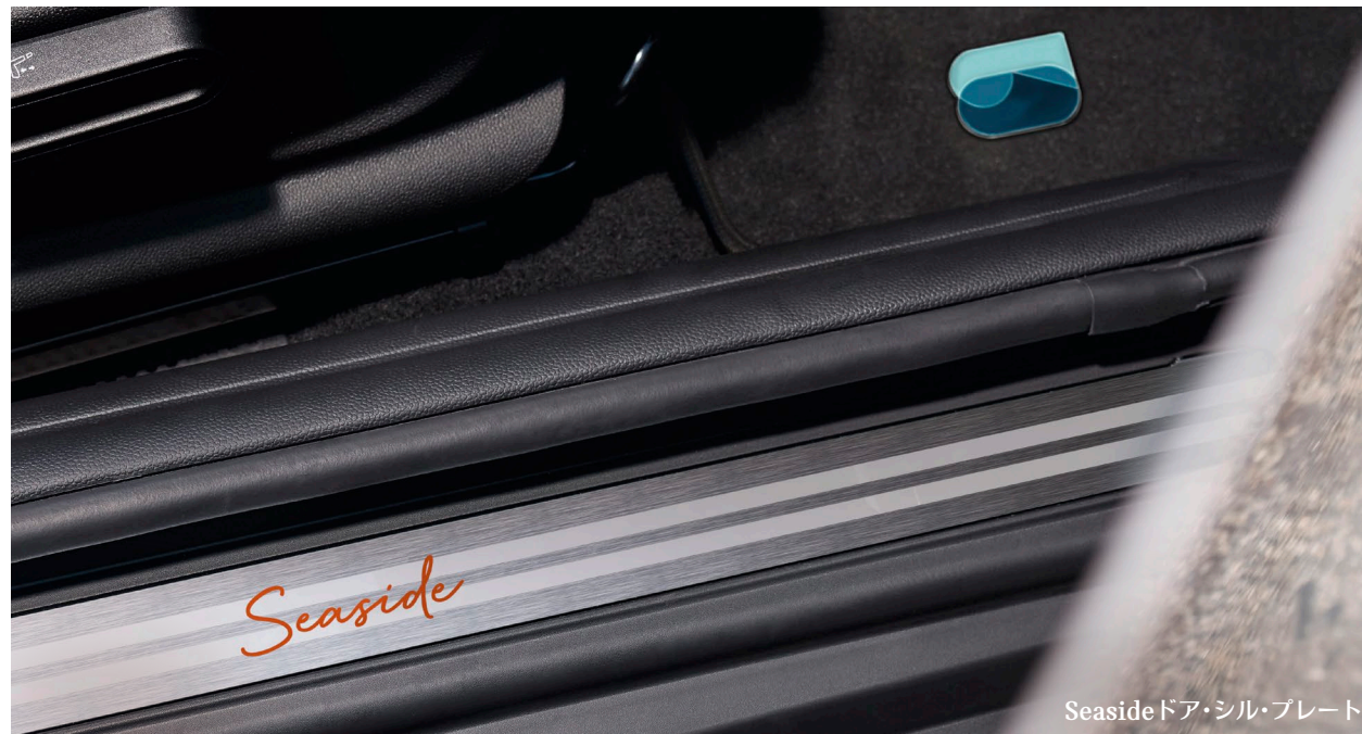
Seaside ドア・シル・プレート

室内にもスタイリッシュに あしらわれたオリジナルデザイン。 爽やかな「Seaside」のレタリングとともに、 ドアを開けるたび心地よく出迎えてくれます。