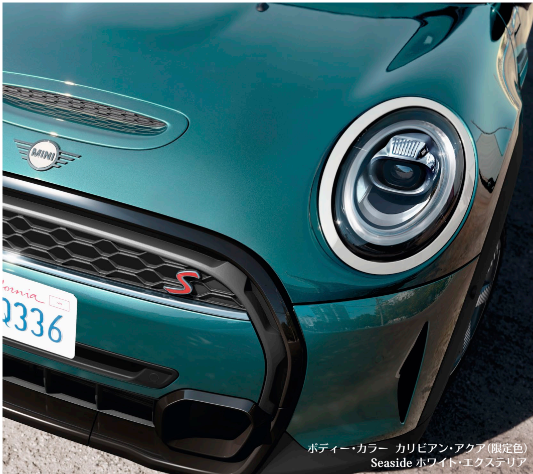
ボディー・カラー カリビアン・アクア(限定色) Seaside ホワイト・エクステリア