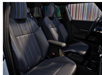
専用ベスキム/コード コンビネーション ナイトシェード・ブルー （Paul Smithストライプ・デザイン、 Paul Smithエンブレム付） John Cooper Worksスポーツ・シート