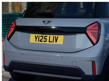
専用MINIエンブレム ブラック・ブルー（フロント/リア） 専用テールゲート・ハンドル （Paul Smithレタリング入り）