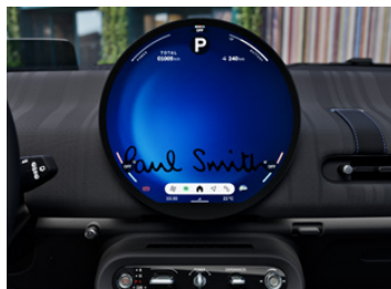
専用センター・ディスプレイ Paul Smithデザイン*