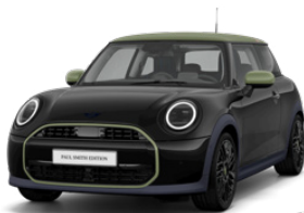
MINI COOPER PAUL SMITH EDITION. ミッドナイト・ブラックII