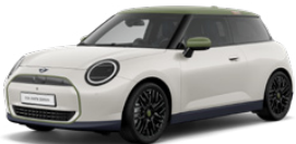
インスパイアード・ホワイト (専用ボディー・カラー)