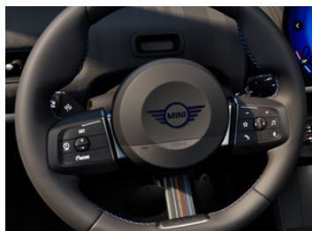
専用スポーツ・ステアリング・ホイール （Paul Smithエンブレム、 ブラック・ブルー・ステッチ、 Paul Smithシグニチャー・ストライプ）