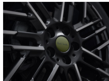
18インチ ナイトフラッシュ・スポーク ブラック（専用ホイール・キャップ付）*