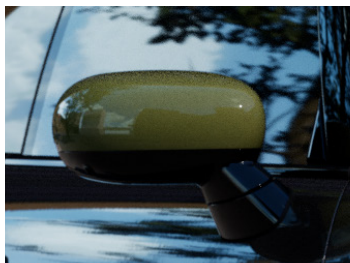
専用ミラー・キャップ ノッティンガム・グリーン