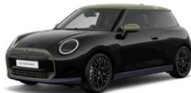
ミッドナイト・ブラックII