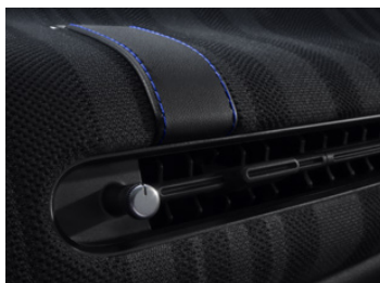
専用ダッシュボード Paul Smithストライプ・デザイン （ブラック/ブラック・ブルー）*