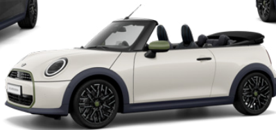
MINI COOPER CONVERTIBLE PAUL SMITH EDITION. インスパイアード・ホワイト (専用ボディー・カラー)

MINI COOPER 5-DOOR PAUL SMITH EDITION. ステイトメント・グレー (専用ボディー・カラー)