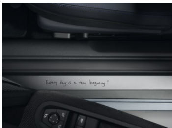
専用ドア・シル（サー・ボール・スマス ハンドライティング・デザイン・メッセージ入り）*